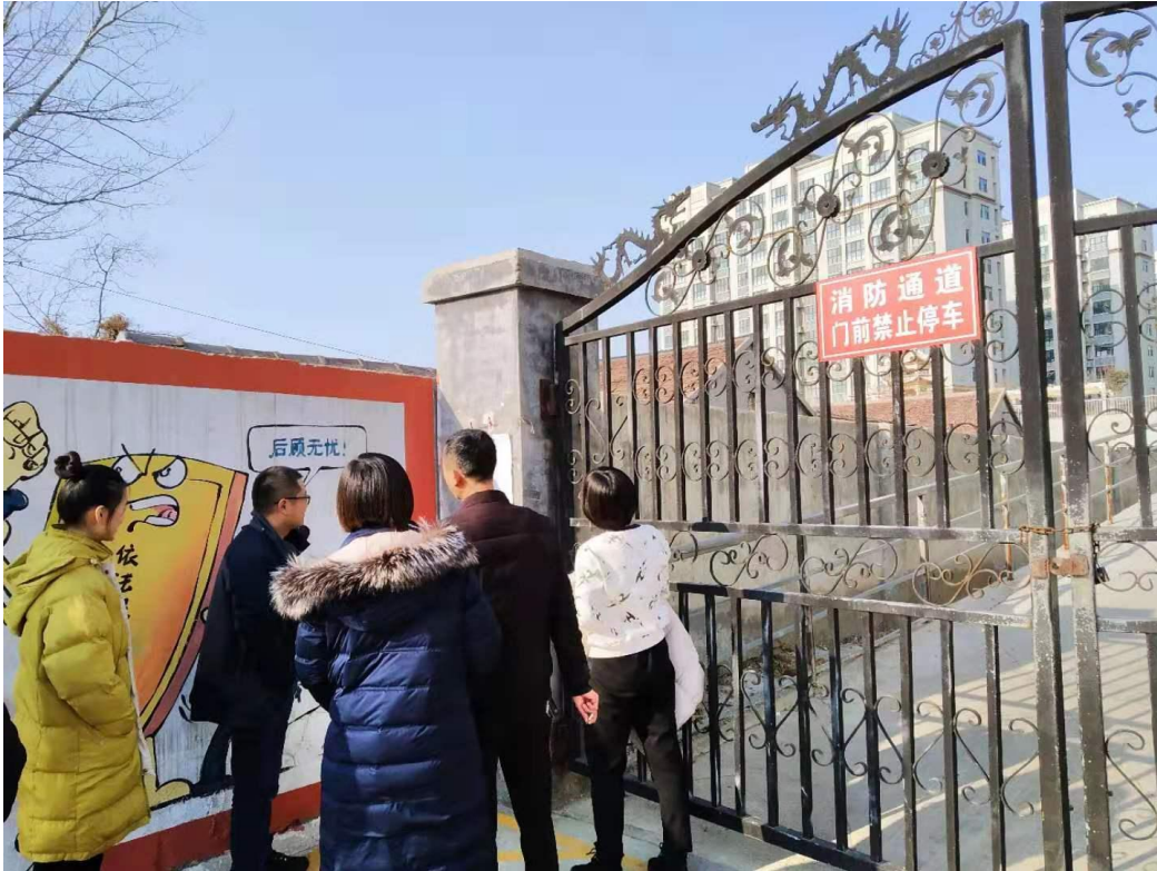
图 5 项目征求意见稿张贴公示截图