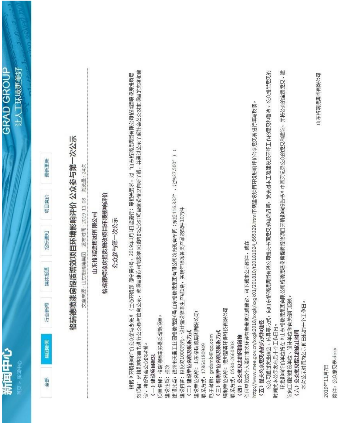
图 1 本项目第一次网站公示截图