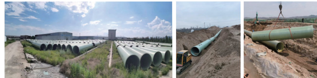
内蒙古岱海生态应急补水项目（管径DN2000，合同额1.57亿元）