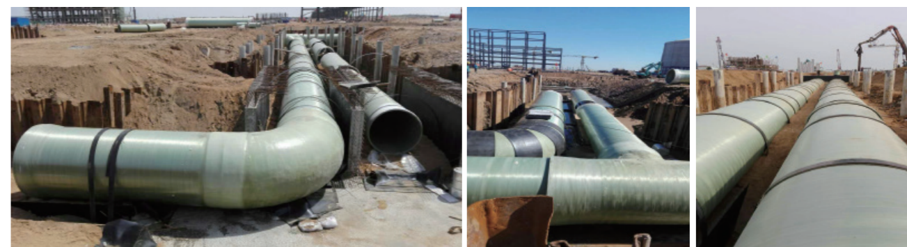
中国石化天津液化天然气（LNG）项目（管径DN2200，海水管道，合同额2000万元）