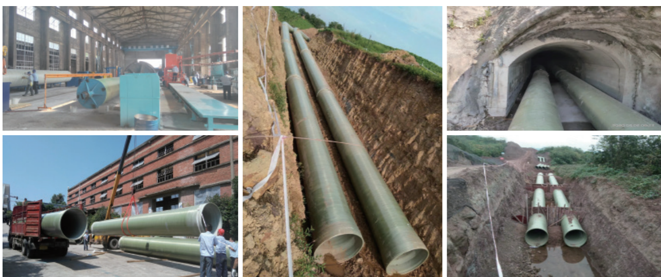
四川省小井沟水利工程项目（管径DN1200，合同额9000万元）