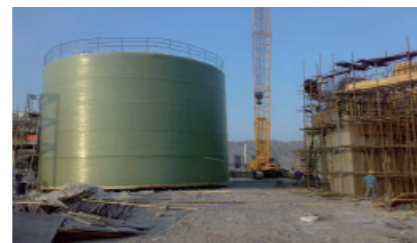
现场缠绕玻璃钢储罐