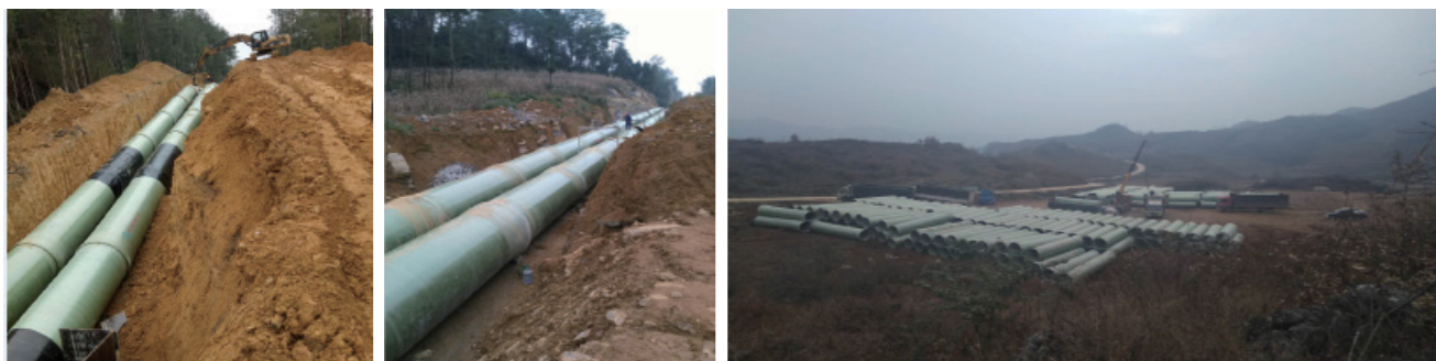
贵州省夹岩水利枢纽及黔西北供水项目（管径DN2200，合同额3亿元）