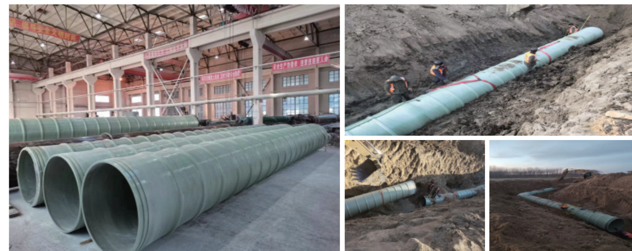
辽宁省阜新市彰武县旱改水项目（管径DN1200，纯工艺加筋管，合同额1550万元）