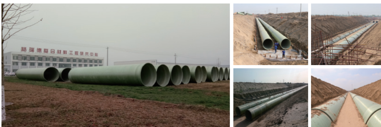
山东省黄水东调应急工程玻璃钢管采购项目（管径DN2400，合同额1.45亿元）