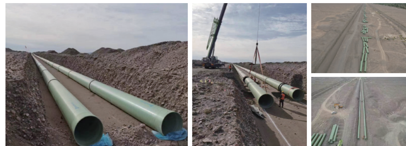
新疆库尔勒第二水源地建设项目（管径DN1600，合同额1.1亿元）