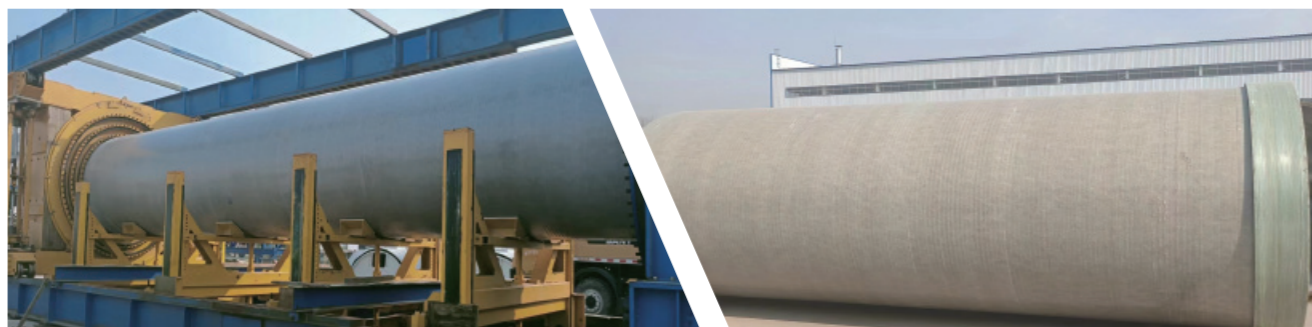
中国水利水电第五工程公司重庆DN2000连续玻璃钢管道项目