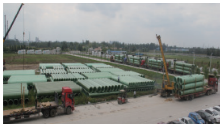
缠绕给排水、通风管道

玻璃钢矩形通风管道、玻璃钢风阀、玻璃钢集气罩、生物除臭箱，各类电解槽、事故池、污水池、储罐围堰的现场施工防腐。