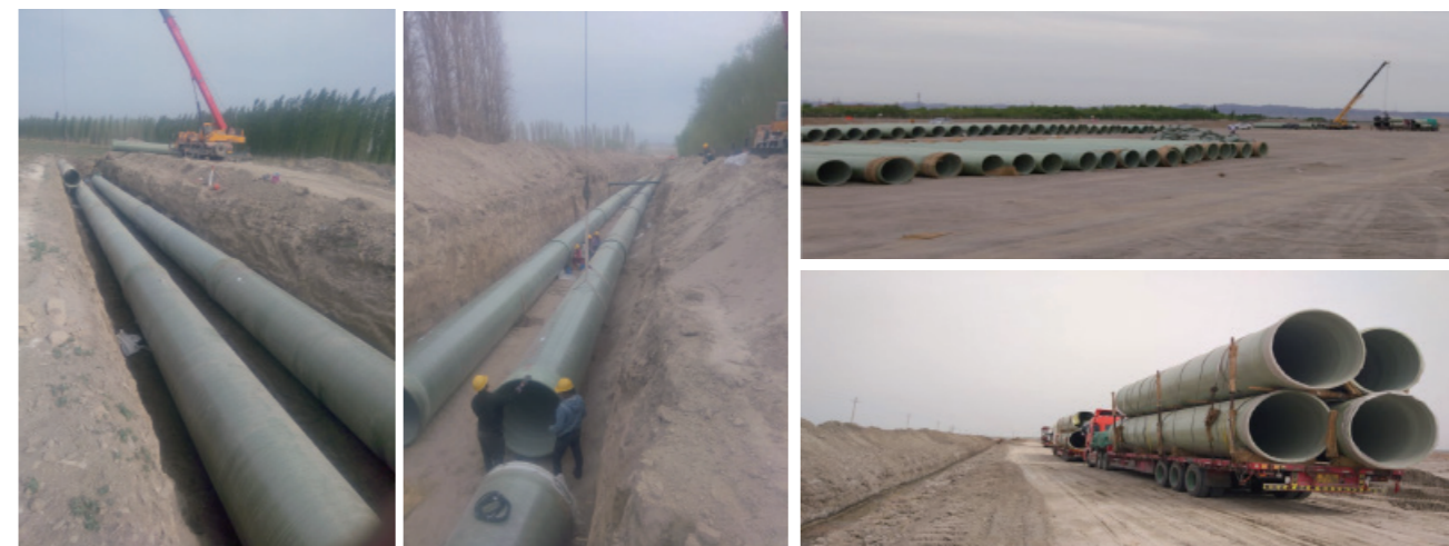
南水北调东线一期玻璃钢管道项目（管径DN1400，合同额8500万元）